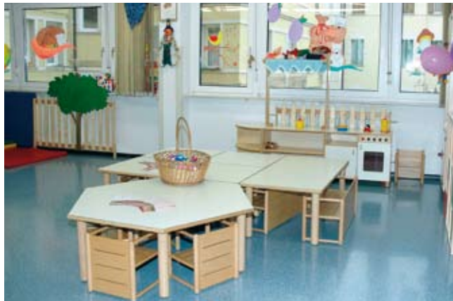
Kindertagesstätte Quireiner Wassermauer